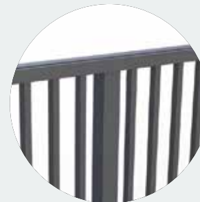
30 x 30 mm

Sie können aus den folgenden Parkettierungen wählen: