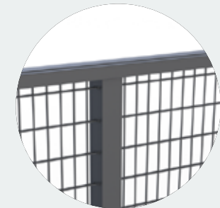
Doppelstabmatte 8/6/8 mm